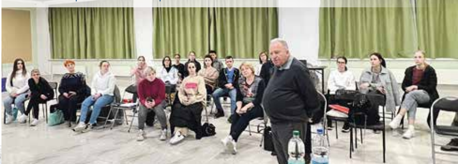
Почетный вице-президент ISU Александр Лакерник постоянно на связи с Южно-Сахалинском, часто бывает на острове и знает о жизни «Кристалла» не понаслышке

Стакой оценкой согласна и Серковская. Сейчас в школе на бюджетном отделении занимаются 133 человека от 6 до 15 лет. Есть и платная группа. Преобладают девочки. Мальчишек больше привлекает хоккей, тем более что «Сахалинские акулы» до не-