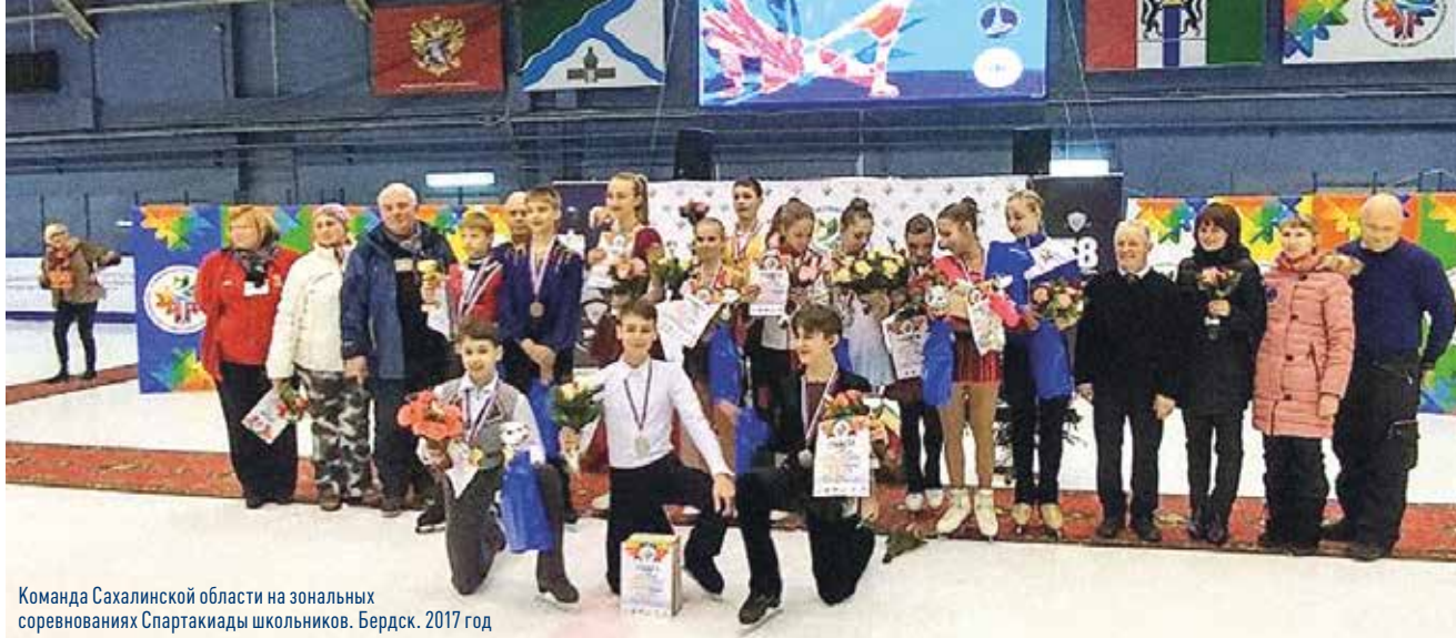
Команда Сахалинской области на зональных соревнованиях Спартакиады школьников. Бердск. 2017 год